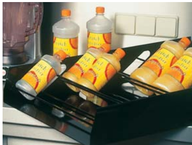
Der Flaschenboy für eine ideale Präsentation Ihrer Saftflaschen.