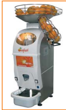
Die Elite T-Automatic mit Vorratskorb.