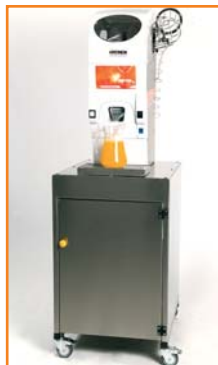
Counter auf Wagen.