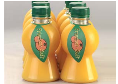
Sie brauchen Flaschen/Becher? Fragen Sie uns!