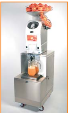
Die SB-Maschine mit Zapfhahn zur Selbstbedienung.