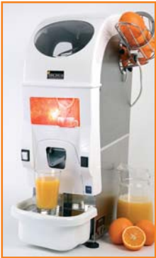
Die Elite TM – Tischmodell.