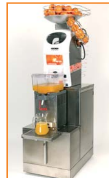
Mit Saftvorratsbehälter, gekühlt oder ungekühlt.