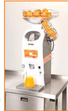
Schalenabfälle durch die Tischplatte: die Countermaschine (mit oder ohne Vorratskorb).