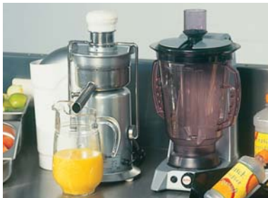
Saftzentrifuge Z-130 und Mixer SB-4 für Misch- & Gemüsesäfte.