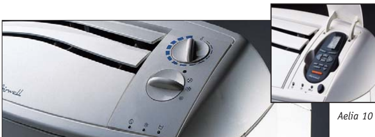
Bedienfeld Aelia 10 CD