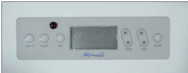
Bedienfeld Aely 9