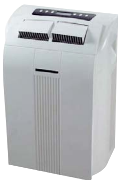
Kompaktgerät Aely 12