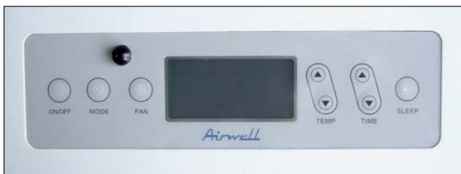
Bedienfeld Aely 12