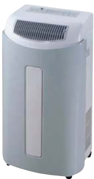
Kompaktgerät Aely 9

Da die mobilen Geräte mit Rollen ausgestattet sind, können sie überallhin verschoben werden. Installationsarbeiten entfallen vollständig, eine Steckdose genügt. Die Lösung für Mietwohnungen, denn das Klimagerät zieht im Fall der Fälle ohne Demontage mit Ihnen um.