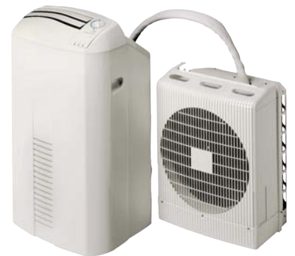
Splitgerät Aelia 14 N