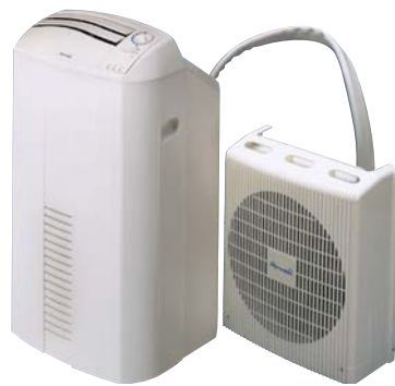
Splitgerät Aelia 10 N