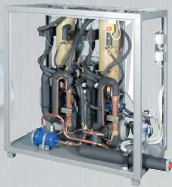
UBE 5.000 R = UBE 5.000 E