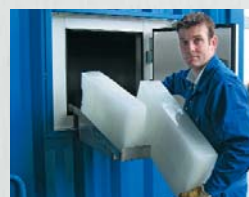
Container + Block Eis