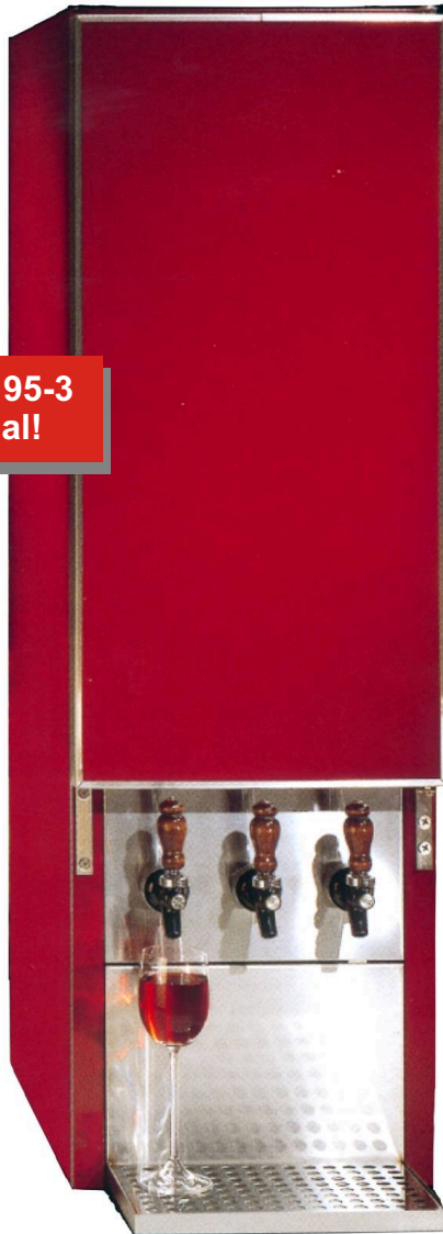
Abb.: DKS 95-3