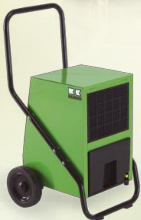
REMKO AMT 40-E