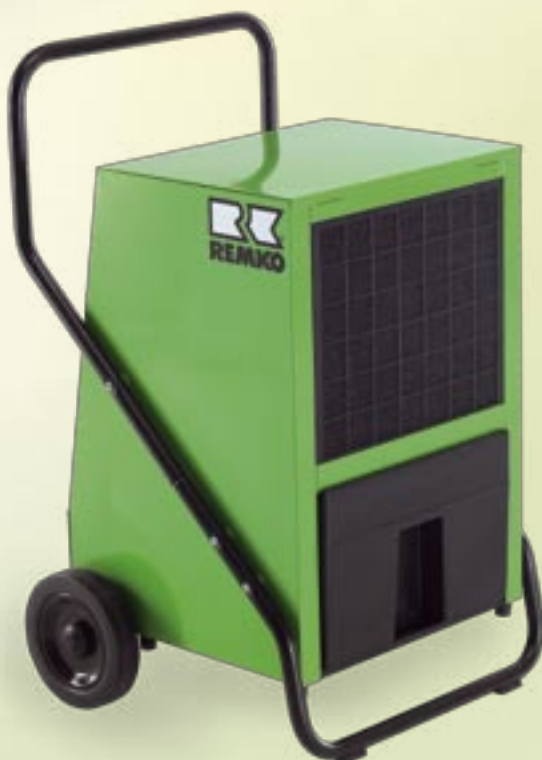
REMKO AMT 80-E