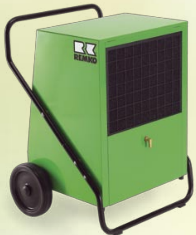
REMKO AMT 110-E