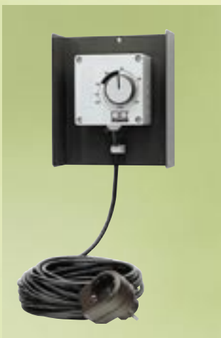
REMKO Raumhygrostat, Typ HR-1, zur vollautomatischen Steuerung, steckerfertig

REMKO Luftentfeuchter eignen sich hervorragend zur wirtschaftlichen Raumtrocknung im Keller und Trockenkeller, Hobbyraum, Wintergarten, Bad, Werkraum, Freizeitraum, Archiv, Lager etc.