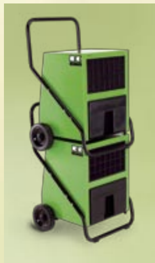
REMKO Luftentfeuchter sind stapelbar

Die fahrbaren Luftentfeuchter REMKO AMT sind leicht zu bedienen und garantieren störungsfreien Dauereinsatz rund um die Uhr.