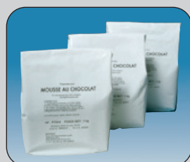
Mousse au Chocolat