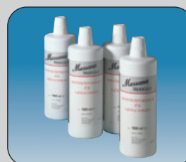
Mikroclean 4 x 1 L 12 x 1 L