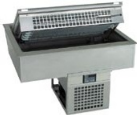
Snack E mit hochgeklapptem Verdampfer