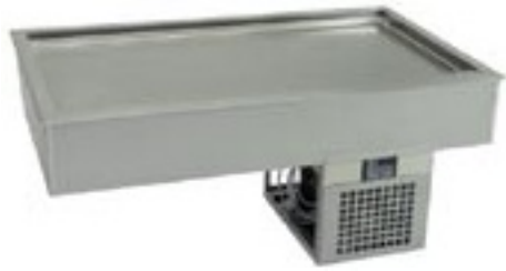
Snack 3 E-XL