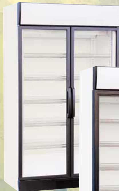
KU 1050 DR