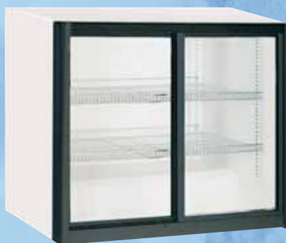
KU 250 G