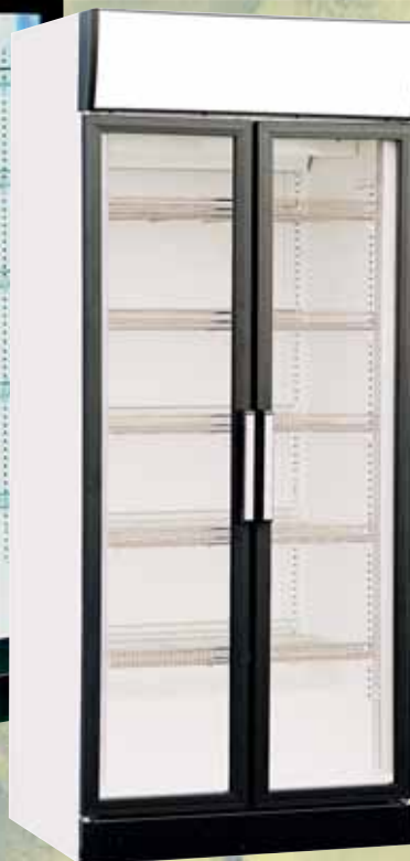
KU 760 DR