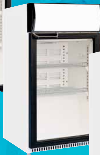
KU 85 G mit Leuchtaufsatz