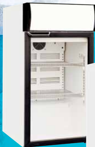
KU 156 G mit Leuchtaufsatz

Mehr Platz in der Höhe benötigen die Modelle inklusive eines hellbeleuchteten Werbeaufsatzes. Dafür bieten Sie allerdings auch mehr Platz für die wirkungsvolle Präsentation von Firmen- oder Markenlogos. Fallen Sie doch einfach auf... Das Modell KU 156 gibt es auch als tiefkühlendes Pendant. Sowohl mit als auch ohne Leuchtaufsatz.