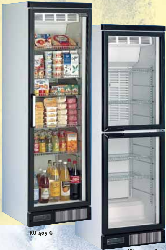
KU 405 G