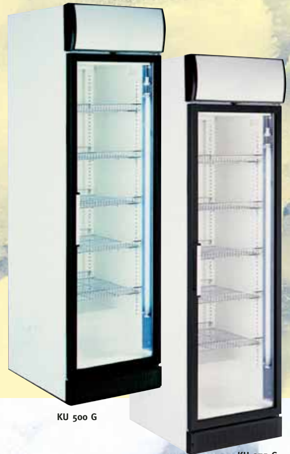
KU 500 G

Die Modelle KU 275 G und KU 500 G warten serienmäßig mit dem hellerleuchteten Werbeaufsatz auf. Auch das Modell KU 500 G hat ein tiefkühlendes Pendant (TKU 500 G).