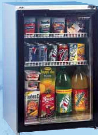
KU 85 G