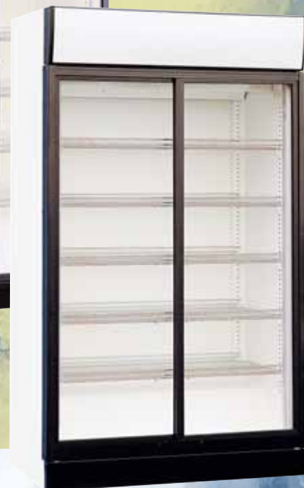
KU 1050 SG

Die Besonderheit der „ganz Großen“: Sowohl das 760 Liter- als auch das 1050 Liter-Modell sind entweder mit Dreh- oder Schiebetüren erhältlich.