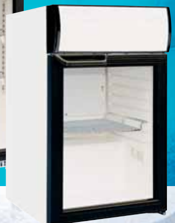
KU 45 G mit Leuchtaufsatz