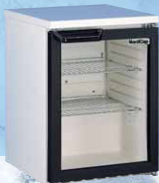
KU 45 G