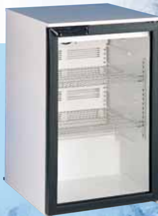
KU 156 G