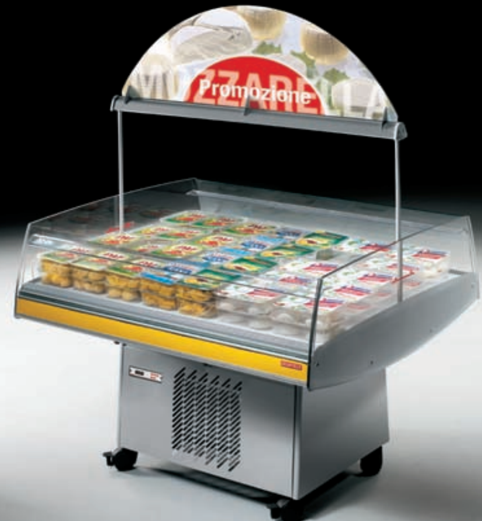
Accessori - Optional: