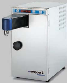
WHIPPER 2 EXCLUSIVE