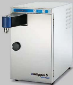
WHIPPER 5 CLASSIC