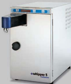
WHIPPER 5 EXCLUSIVE