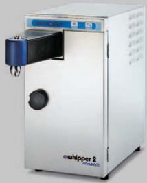
WHIPPER 2 CLASSIC