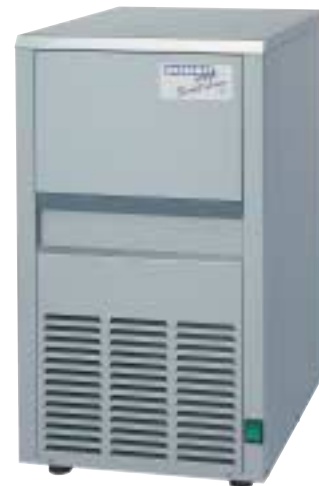
Abb. Modell S 18 L / W

Smart-Line Der preiswerte Eiswürfelbereiter für den kleinen Bedarf.