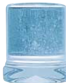
Volleiswürfel Ø 27 x 32 mm · Gewicht 18 g.

Das Eisbereitungssystem der Smart-Line produziert zylindrische Volleiswürfel im Format 27 x 32 mm. Die Eiswürfel sind glasklar. Sie haben eine feste Konsistenz und sind für das Kühlen von Speisen und Getränken sowie eine Vielzahl anderer Verwendungszwecke hervorragend geeignet. Mit einer Leistung von 18 kg Eiswürfeln (ca. 1.000 Stück) pro Tag und einem Eisvorrat von 6,5 kg (ca. 350 Stück) bieten die Modelle S 18 L / S 18 W eine ausreichend große Menge für Anwender mit geringem Bedarf.