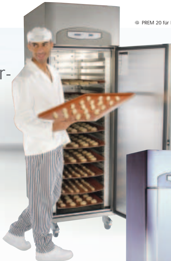
● PREM 20 für Backbleche