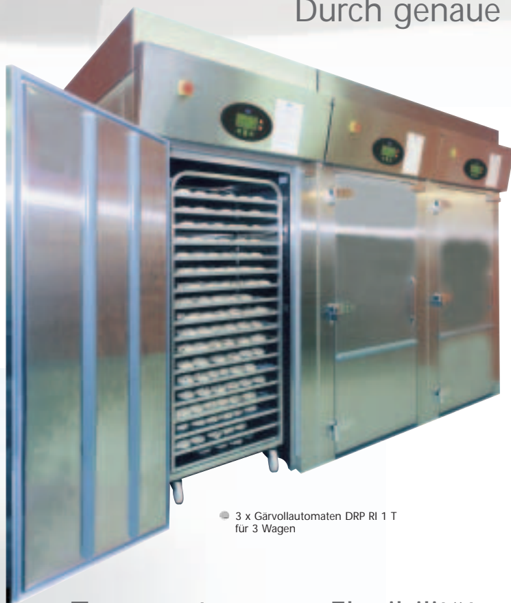
● 3 x Gärvollautomaten DRP RI 1 T für 3 Wagen

Durch genaue Kontrolle Kosten reduzieren