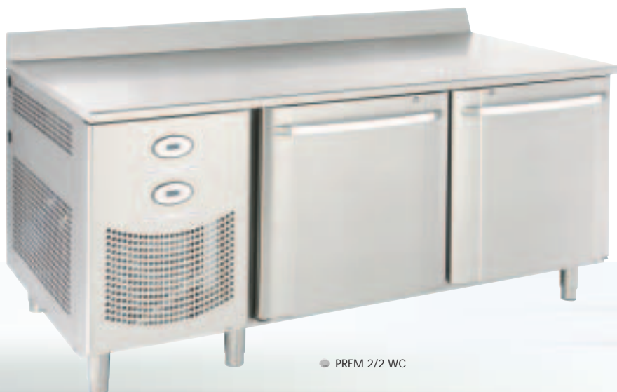
PREM 2/2 WC