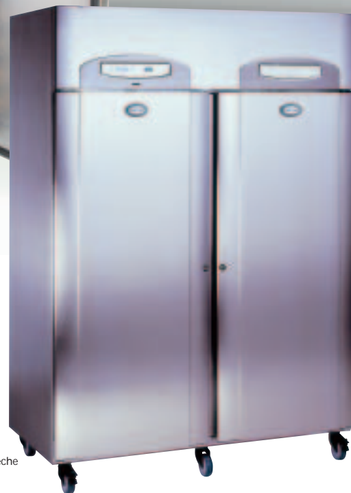
● PREM 40 für Backbleche