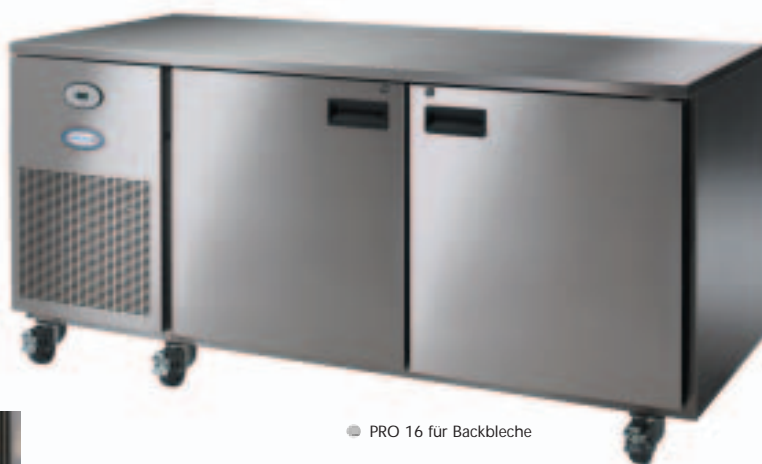
● PRO 16 für Backbleche