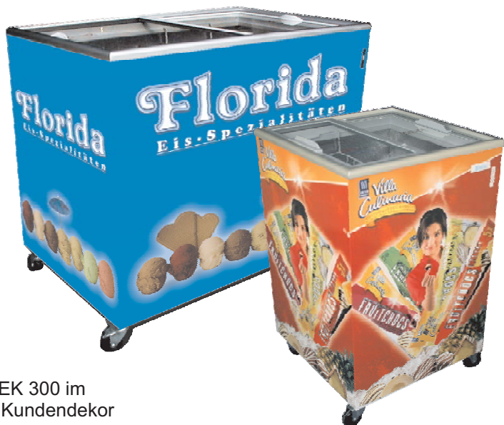
Abb.: EK 300 im Kundendekor