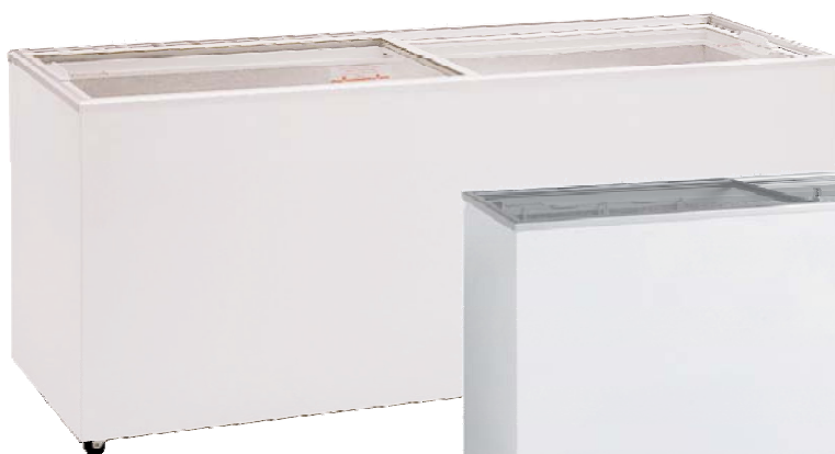
Abb.: EK 700