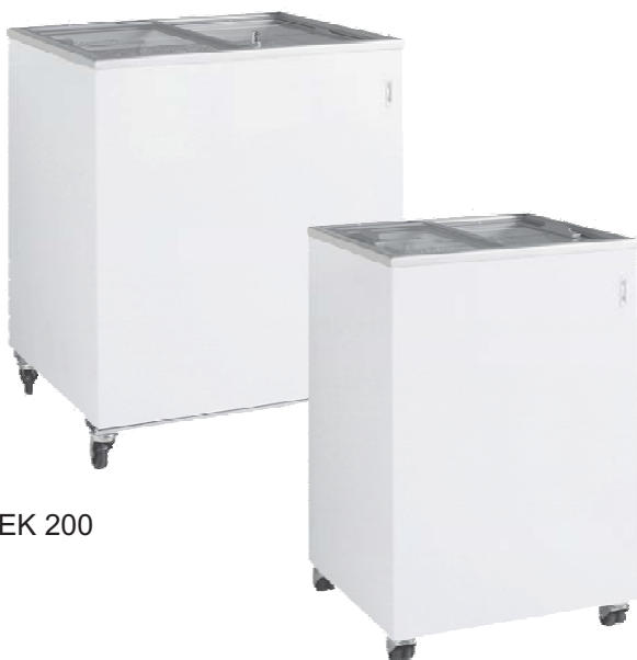
Abb.: EK 200