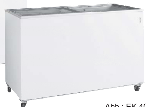
Abb.: EK 400