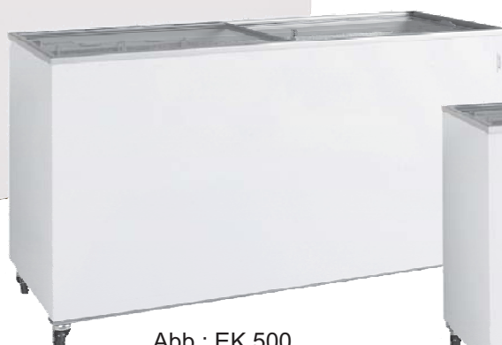
Abb.: EK 500