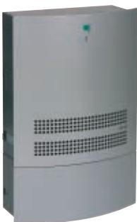
CDF 10 mit Wasserbehälter